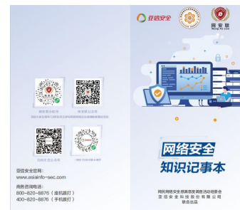
网络安全知识小册子