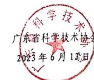
▲ 指导单位：广东省科学技术协会