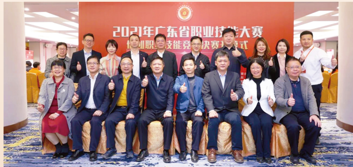
2021年广东信创大赛(广东省信创职业技能竞赛)嘉宾合影

作为首届广东省信创职业技能竞赛,以实际行动响应了国家技能人才战略和信息技术应用创新战略的要求,竞赛取得了骄人的成绩,得到了广泛的社会赞誉。