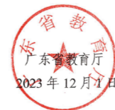
▲ 指导单位：广东省教育厅