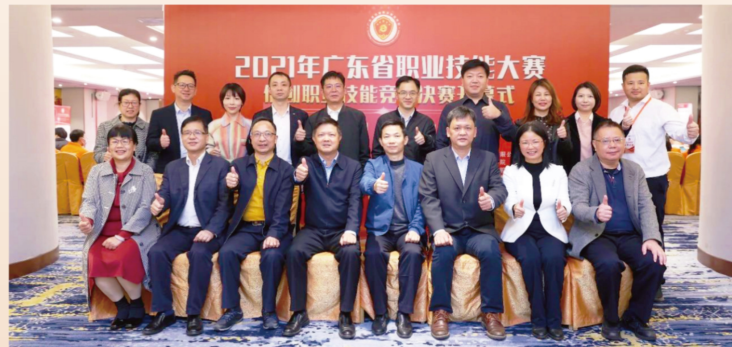
2021年广东信创大赛(广东省信创职业技能竞赛)嘉宾合影

作为首届广东省信创职业技能竞赛,以实际行动响应了国家技能人才战略和信息技术应用创新战略的要求,竞赛取得了骄人的成绩,得到了广泛的社会赞誉。