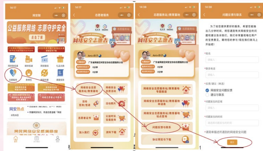
网安联小程序-问题反馈与联系

群众在接受网络安全志愿服务后，可以提供反馈和评价。这有助于改进服务质量和志愿者的表现。服务站会定期评估志愿服务的效果，并根据反馈和评价进行改进和调整。