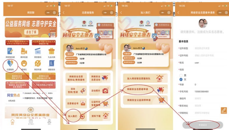
网安联小程序-网安联志愿者实名认证

服务站通过不同的渠道招募志愿者，包括通过网站、社交媒体、网络安全社区等发布招募信息。志愿者可以是专业的网络安全从业人员，也可以是对网络安全感兴趣的普通用户。招募流程可能包括提交申请、面试和培训等环节。