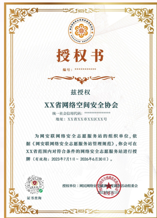
网民网络安全感满意度调查活动组委会授权书

全国范围内的符合要求的社会组织，如联合发起全国网民网络安全感满意度调查活动的网络安全行业协会及相关社会组织等，在网民网络安全感满意度调查活动组委会授权下（授权书样式如右图），在授权的区域内推动网络安全志愿服务站的建立、建设和管理，同时按照《网安联网络安全志愿服务站管理规范》确认区域内站点是否能够获得网安联网络安全志愿服务站资质。