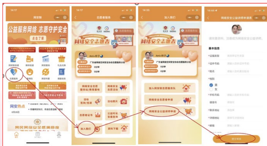
网安联小程序-网络安全公益讲师申请

邀请志愿者参与网络安全公益讲师认证，通过认证的讲师，可以为志愿者提供专业指导和培训。这些讲师可以来自互联网公司、学术机构、学校、街道、志愿团体或其他相关领域，他们应具备丰富的经验和教学能力。