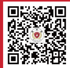
网安联微信公众号