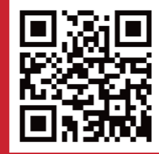
“网络安全共建网”官网